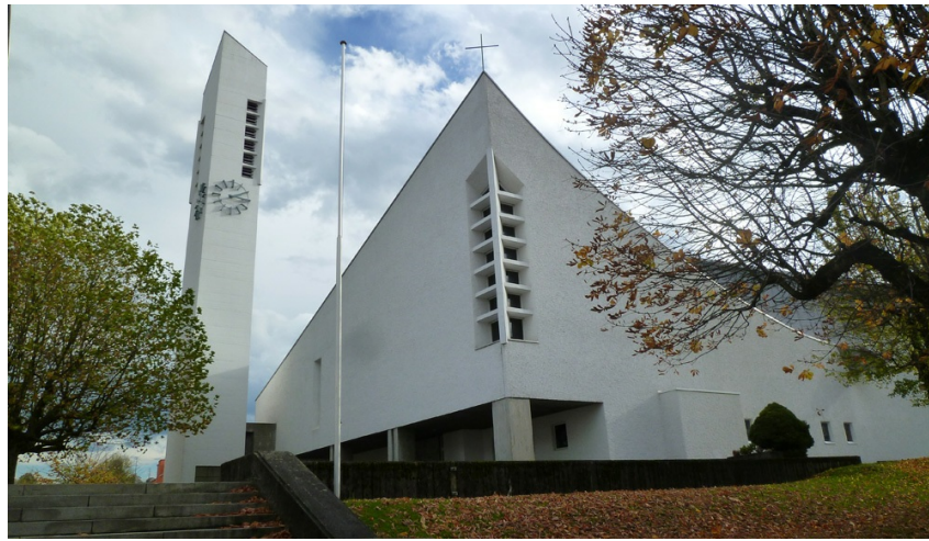
Bruder-Klaus-Kirche St.Gallen-Winkeln - aktuell 600 Jahre Bruder Klaus www.mehr-ranft.ch

pilgern.ch Lilienstrasse 41 9000 St. Gallen Schweiz jakobsweg@pilgern.ch