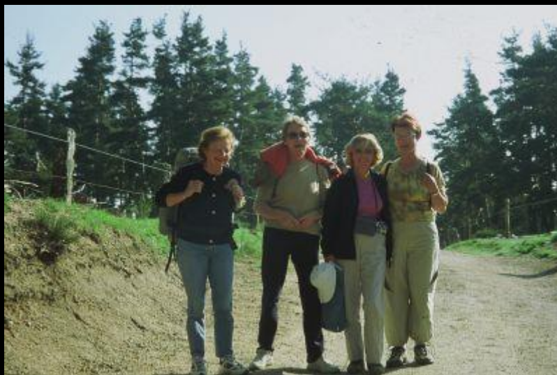
'les quatre dames' pilgern im gleichen Etappenrythmus wie wir