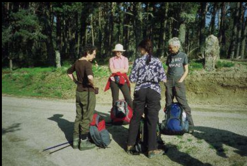
Austausch am Weg