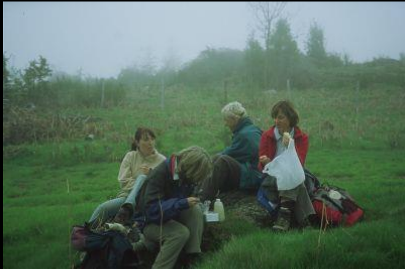
Rast im Nebel