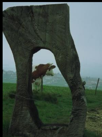
sorgenvoller Blick nach Saugues, wo einst das Bête du Gévaudan wütete