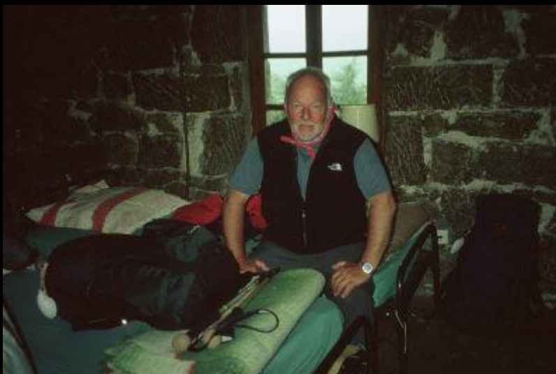
ihm ist hier pudelwohl