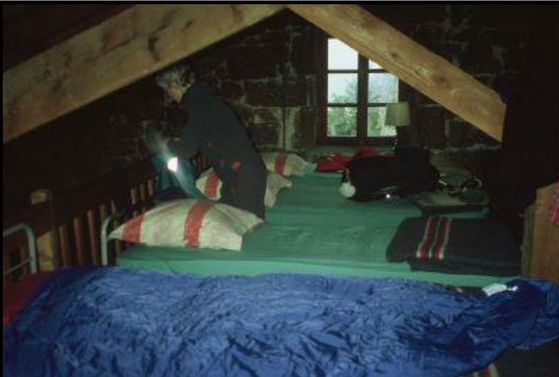
Schlafrum in der Gîte der Domaine du Sauvage