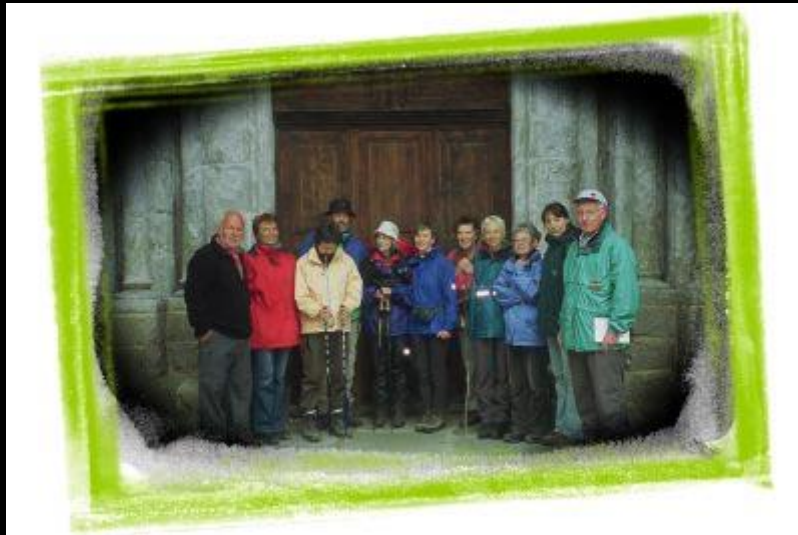
Gruppenbild vor der Kirche in Saugues