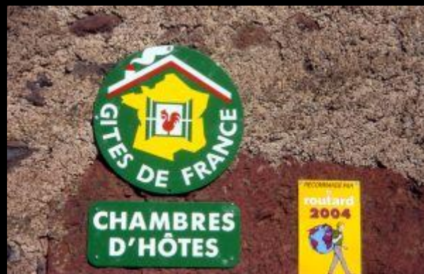
Anzeige der Gîte privé von Les Estrets