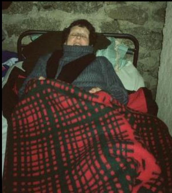
die andere Art, sich Wärme zu besorgen