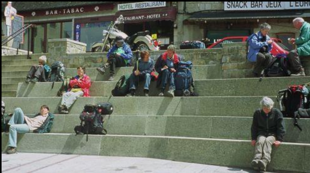
Mittagsrast in St.Alban-sur-Limagnole