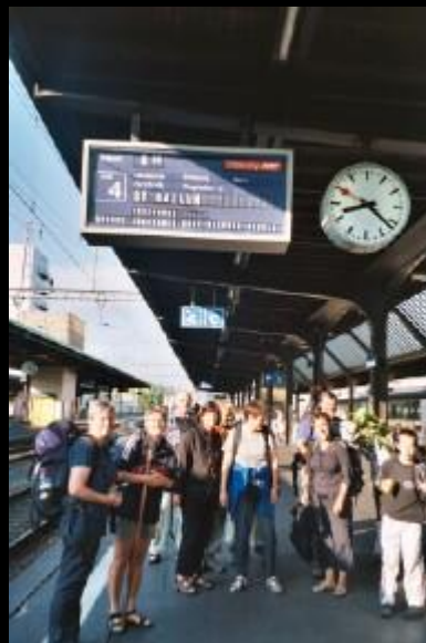
Ankunft am Morgen in Genf. Auf der Anzeigetafel wird unsere Pilgergruppe mit dem Vermerk 'Jakobsweg 2003' empfangen.