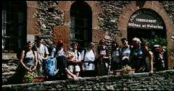
Schlussbild in Conques vor der Herberge 'Abbaye St-Foy'