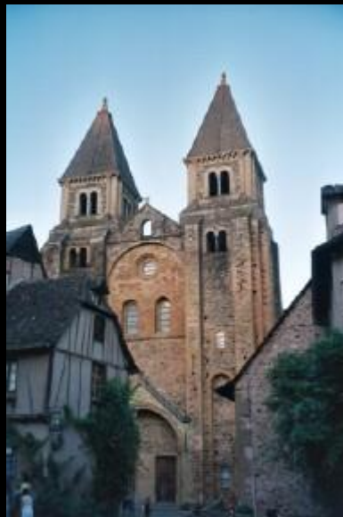
Westfassade der Kirche Sainte Foy (hl.Fides) von Conques.