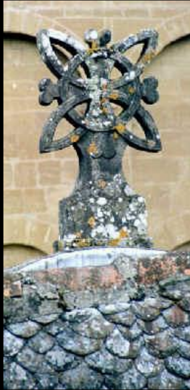
Kreuz an der Kirche von Conques.