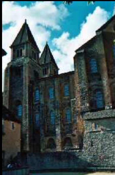
Kathedrale St.Foy von der Seite.