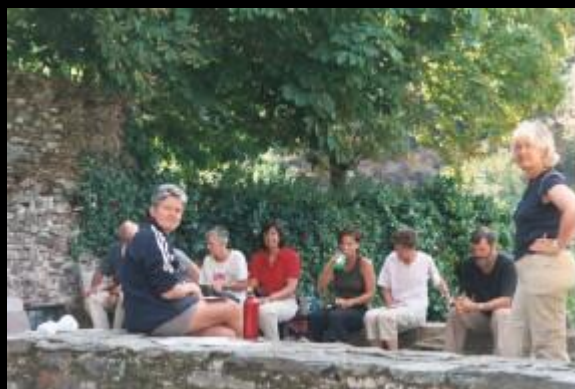
Das letzte Mittags-Picknick der Pilgerreise.

"Jeder und jede geht alleine über die Brücke. Die Blicke der Gruppe begleiten ihn. Eine Brücke zurück in den Alltag, zurück in das Leben nach dem Jakobsweg, mitnehmen und umsetzen, was möglich ist, dankbar sein für das, was war und nun im Alltag Schritt für Schritt weiter gehen." EK