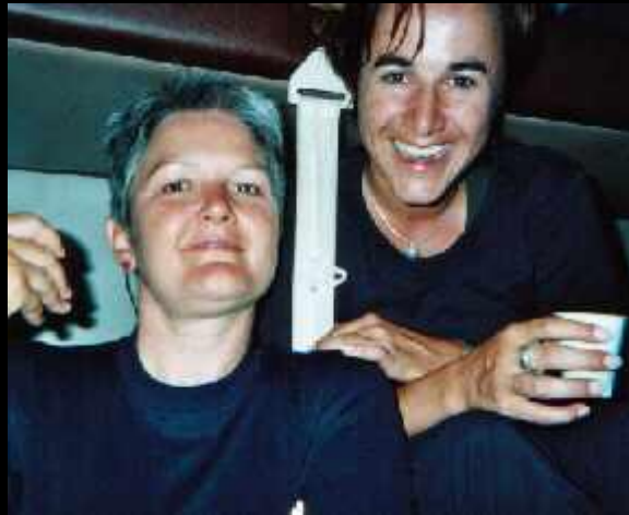
Elisabeth und Elisabeth auf der Heimreise