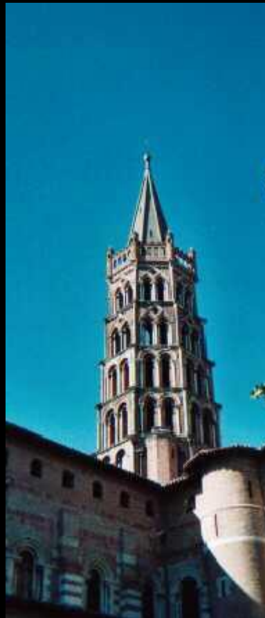
Romanische Kirche St.Sernin in Toulouse

Da Conques keinen direkten Bahnanschluss hat, besteht die Möglichkeit, per Sammeltaxi (Taxi Lample) nach St.Christophe zu fahren. Von dort fährt die Bahn nach Rodez, von Rodez nach Toulouse. Ab Toulouse bietet sich der Nachtzug nach Genf an.